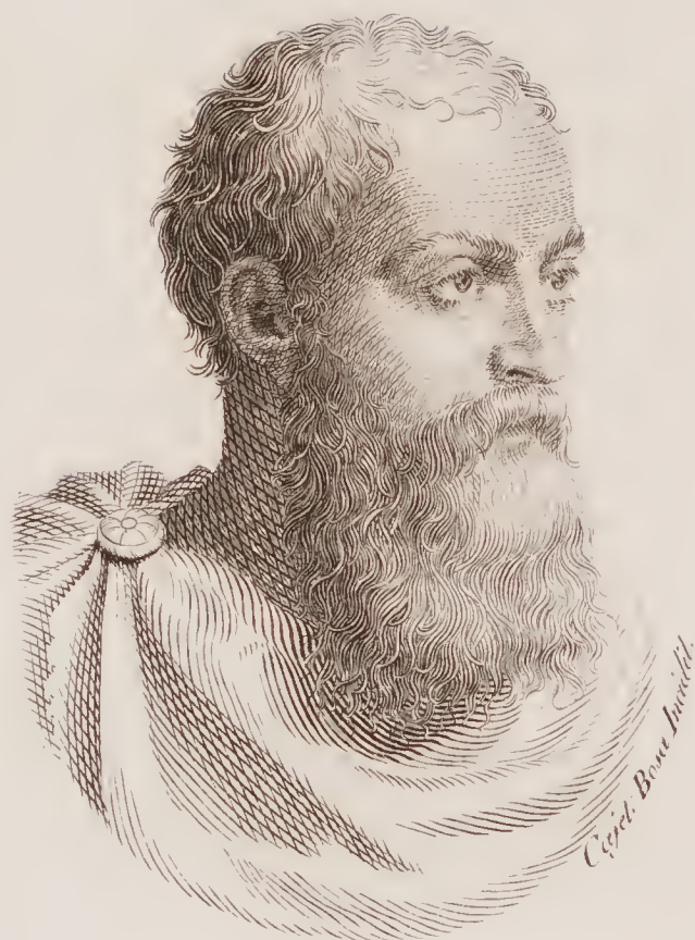
EFFIGIES GEORGII BLANDRATAE PEDEMONTANI PRINCIPVM SARMATIAE TRANSILVANIAE PANNONIAE ARCHIATRI INTIMI Q. CONSILLARII AD FERDINANDVM IMP. ET AD MAXIMILIANVM REGEM ROMANOR. ETC., INTERNVNTII ANNO MDLXX. AETATIS XXXV.